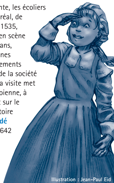
Illustration : Jean-Paul Eid

Connaître le Montréal des enfants de différentes époques... une expérience riche en émotions.