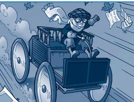
Dessin : Benoît Godbout

Spécialement dessiné pour eux, un grand livre d'images piquera la curiosité des jeunes. Dans chaque salle, le guide y puisera des histoires mettant en scène des enfants et des moyens de transport. L'exploration du musée se terminera par une étonnante balade en tramway... Et, dans le dépliant de la visite, les jeunes trouveront des jeux et des dessins à compléter.