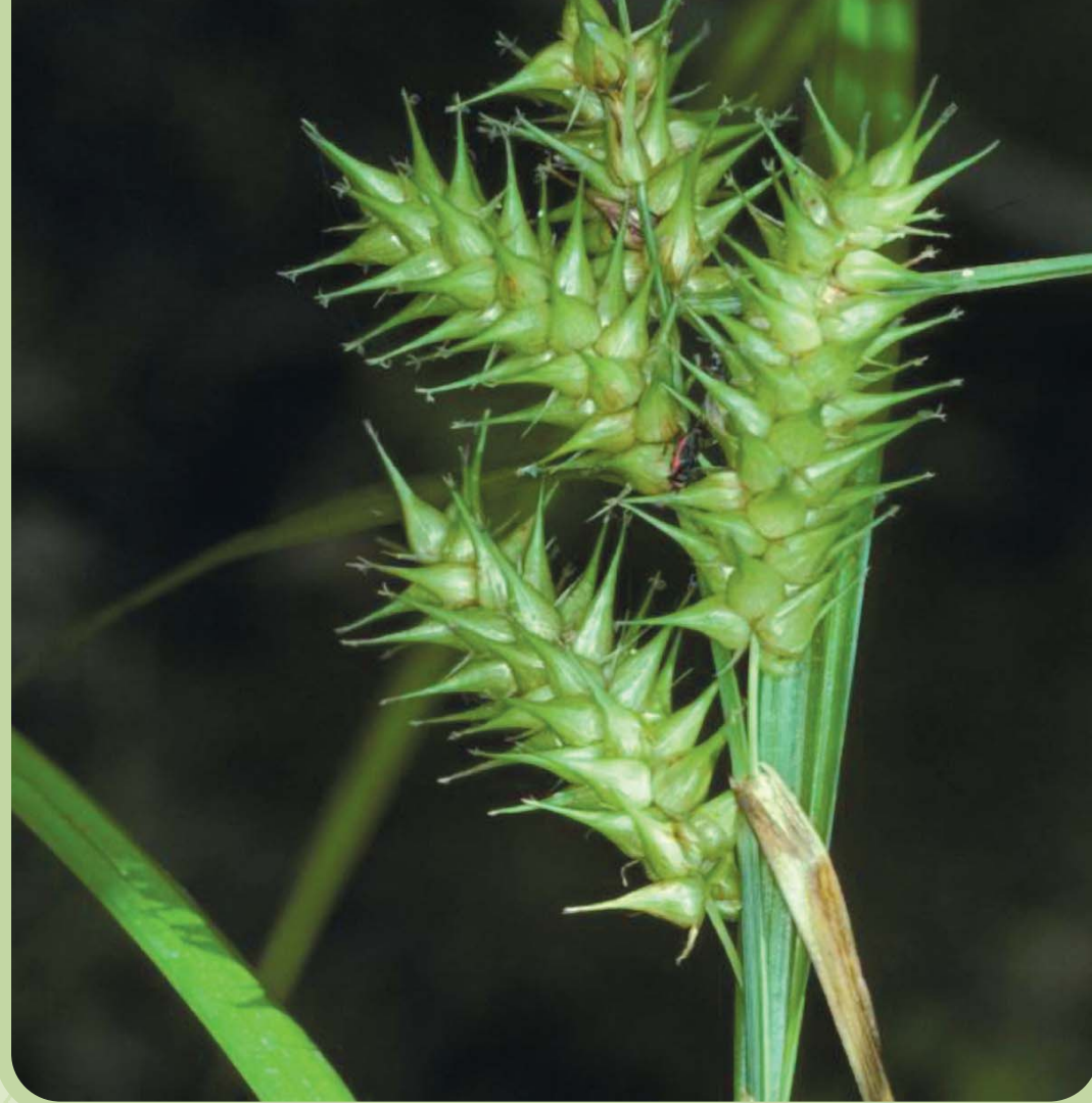
Carex faux-lupulina • False hop sedge • Carex lupuliformis

Les carex sont des plantes herbacées ressemblant sensiblement à des graminées. Le terme carex provient du grec cairô signifiant « je coupe » et ferait allusion aux feuilles coupantes de plusieurs espèces appartenant à ce genre.