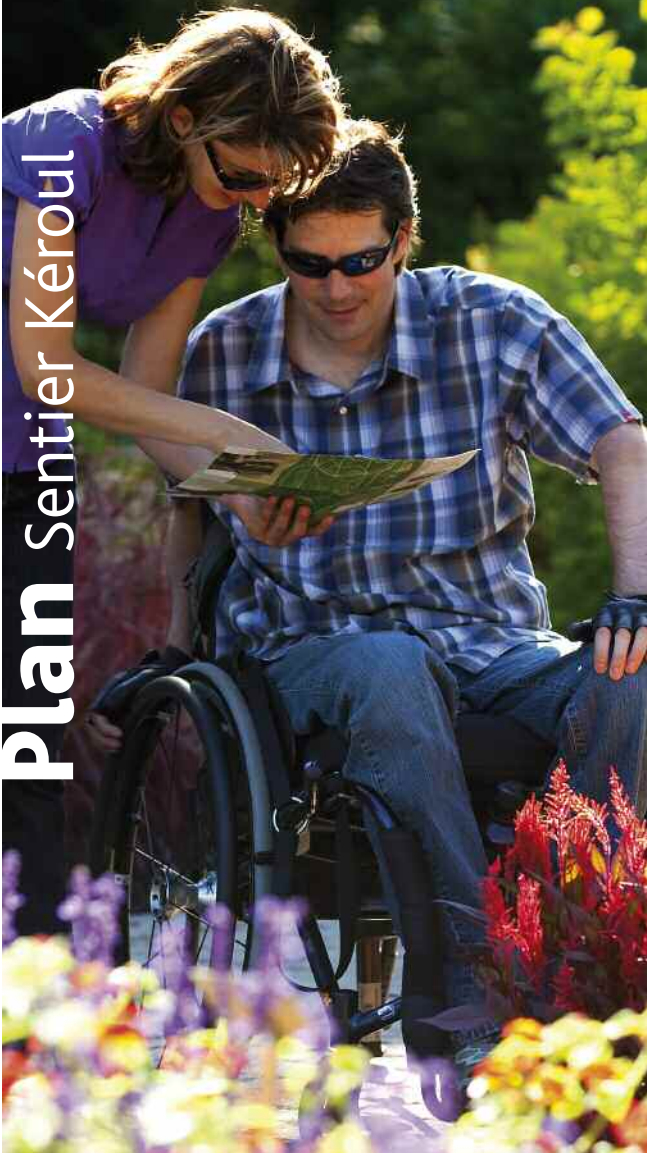
Photos : Mathieu Dupuis, Ministère du tourisme du Québec - Jardin botanique de Montréal (Michel Tremblay) Illustration : Stéphanie Parant