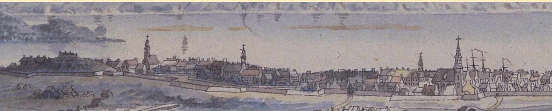
Extrait d'une aquarelle de James Peachey, Vue de la ville de Montréal, octobre 1784