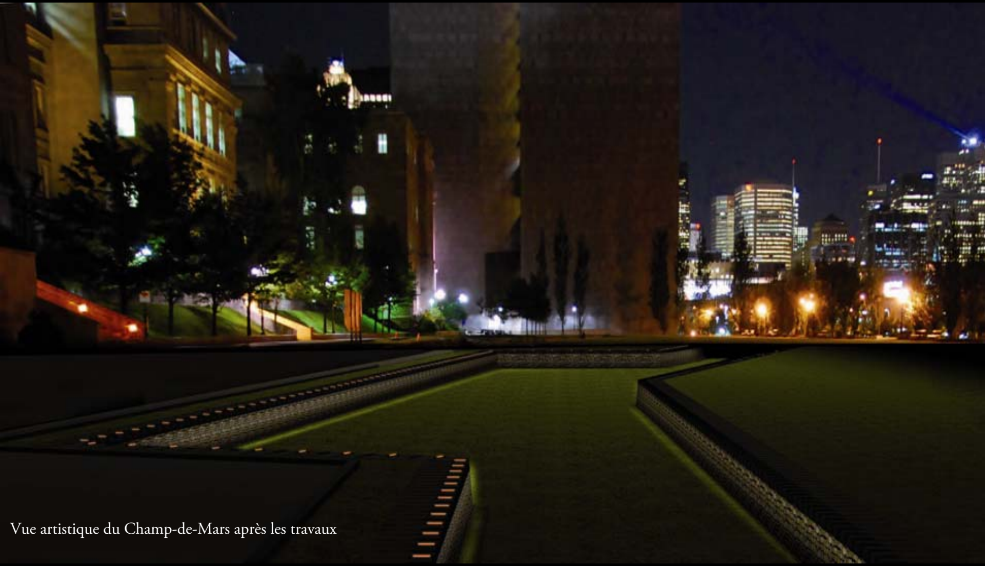
Vue artistique du Champ-de-Mars après les travaux