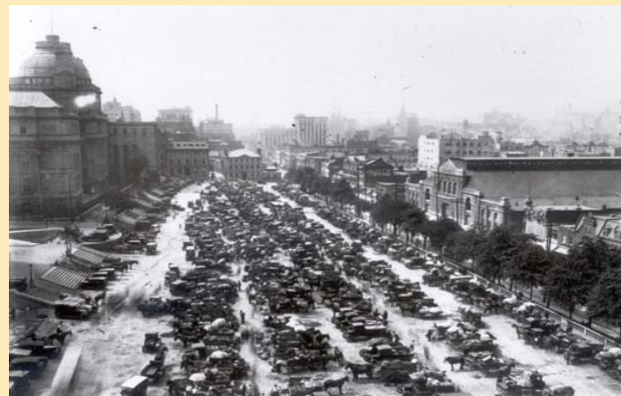
Champ-de-Mars 1920