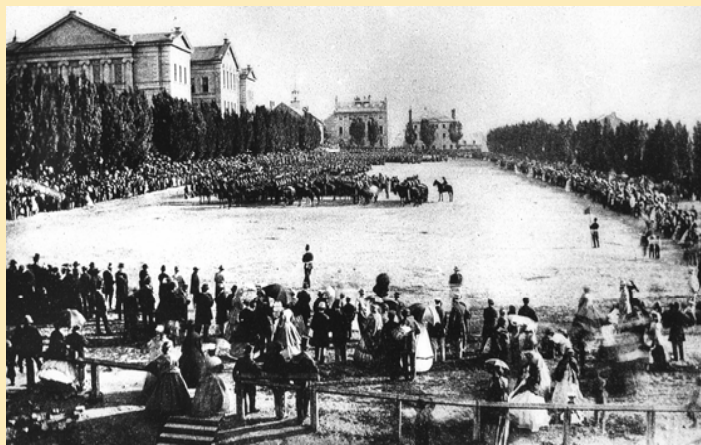
Champ-de-Mars 1860